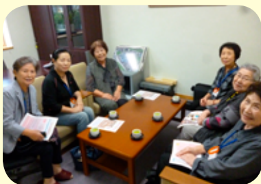
傾聴ボランティア様 (毎月)