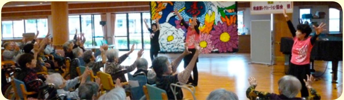
球磨郡レクリエーション協会様 (偶数月)